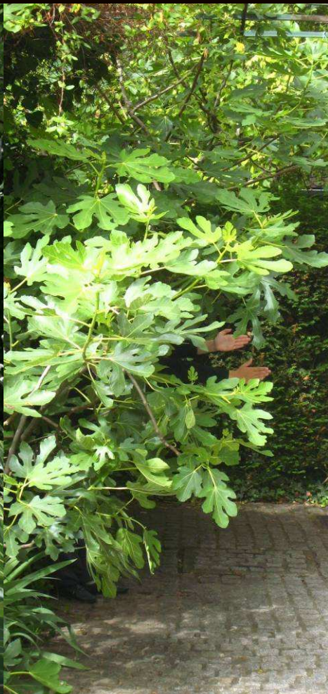
Présence mystérieuse qui apparaît puis disparaît dans le jardins d'une dame » Imane .E