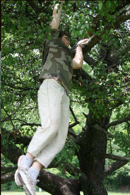
L'arbre isolé dans la prairie dégage une forte présence et m'inspire la tranquillité. Yohan.L