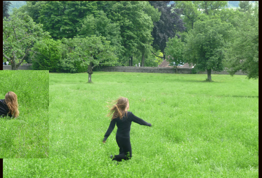
Brise légère, vaste prairie. Liberté. Clélie D